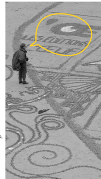
Animation "Sand Graph" à St Malo, dans le cadre du salon "Quai des Bulles" en 2011